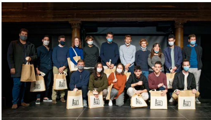
Lauréats du concours 2020