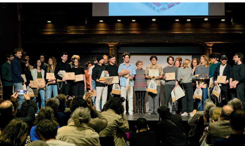
Les finalistes 2024

La cérémonie de remise des prix du concours s'est tenue à l'issue de l'audition des 10 finalistes, le mercredi 24 avril 2024 à la Maison de l'architecture Île-de-France.