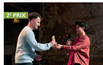
2 E PRIX Hugo CARROS